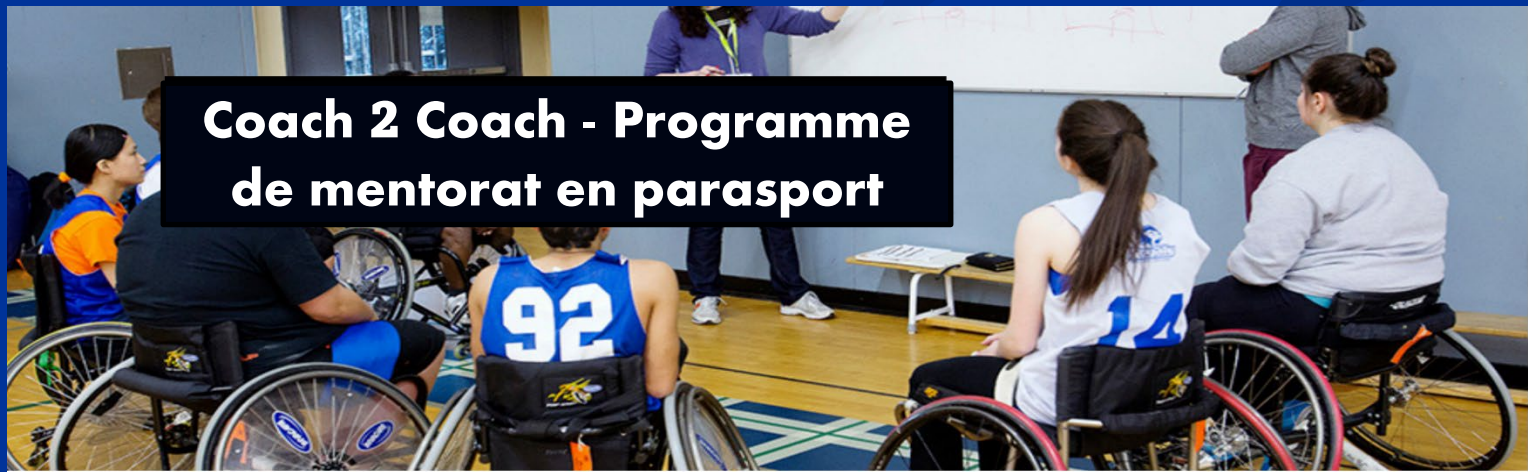
Coach 2 Coach - Programme de mentorat en parasport

Explorer les perceptions et les expériences des entraîneurs mentors et mentorés à la suite d'un programme pilote de mentorat d'entraîneurs et d'entraîneuses formel parasport de 10 mois.